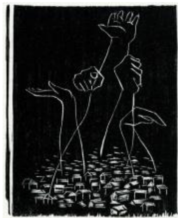
(圖 2：馬德升版畫人民的呼喊 1980 年)

由此可見，儘管詩歌、美術藝術類型不同，但由於共同的群體審美意識，《今天》與「星星」共同從時代命運、主體情感出發，對形式審美進行了相近的現代主義先鋒探索，視覺方式、主題思想表達等相互交叉借鑒。這種彼此應和融洽互動的關係在第二次「星星」美展上得到充分體現。為印製畫展說明書，同時也是《今天》與「星星」藝術理念上的默契，《今天》詩人為畫展大多數繪畫作品配詩，詩歌與繪畫文本構成顯而易見的互文關係，「星星」畫會和《今天》詩群也彼此燭照，取得了先鋒文化協同匯合的審美效果。「星星」畫會與今天詩群的這一行動對於現代繪畫或新詩而言，可說是一種藝術原始情感的回歸，也是先鋒藝術行動有效的當代實踐。